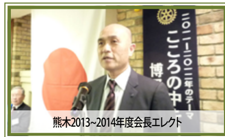
熊木2013~2014年度会長エレクト