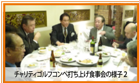
チャリティゴルフコンペ打ち上げ食事会の様子2