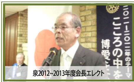
泉2012~2013年度会長エレクト