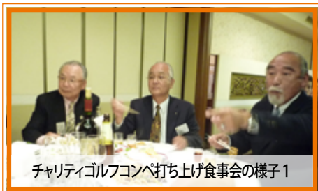
チャリティゴルフコンペ打ち上げ食事会の様子1