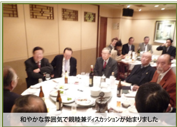
和やかな雰囲気での親睦兼ディスカッションが始まりました