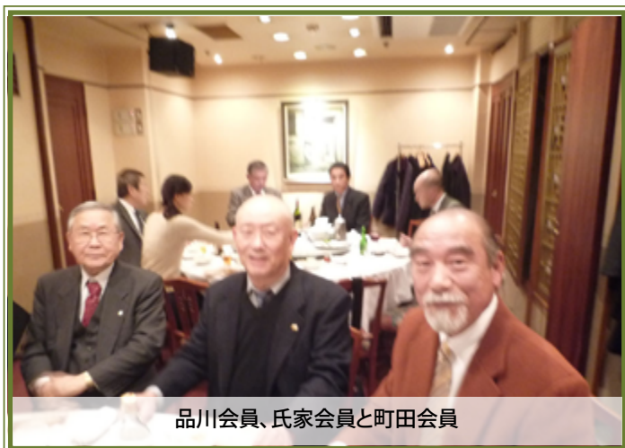
品川会員、氏家会員と町田会員