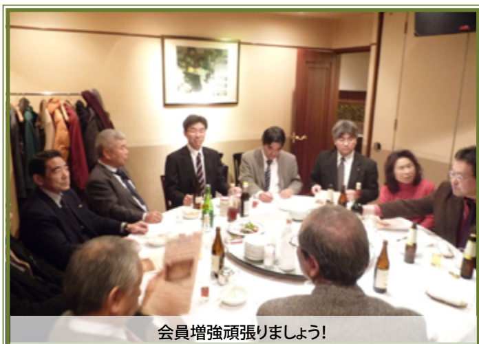
会員増強頑張りましょう!