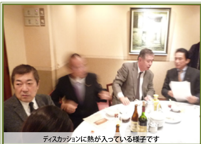
ディスカッションに熱が入っている様子です