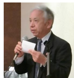
出席報告 : 見富会員