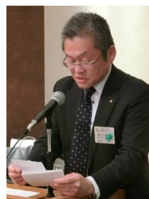
スマイル報告 : 星沢会員