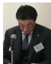
スマイル報告：坂庭会員

本日のスマイル合計： 44,000円 本年度スマイル累計： 1,111,000円