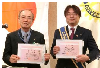
←会員増強貢献者表彰 (林会員)