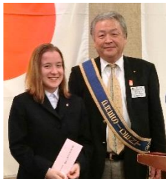
米山奨学金授与と留学生へお小遣い授与