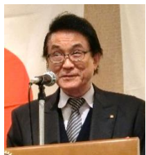
切敷会報公共イメージ副委員長 堀越副委員長