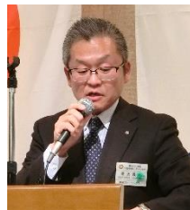
星沢職業奉仕委員長