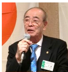
林会員増強副委員長