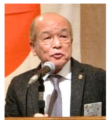
坂国際奉仕委員長