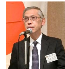
松山青少年奉仕委員長