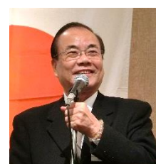
星野プログラム委員長