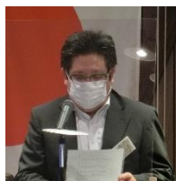
四つのテスト：堀越会員