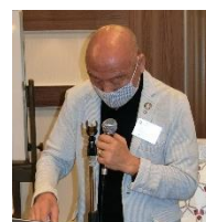
スマイル報告：町田会員