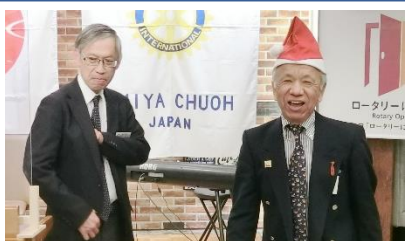
↑松山会員より退会の挨拶