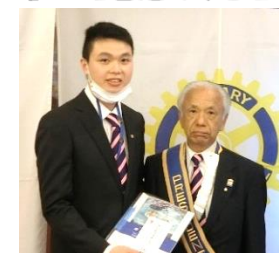
↑レミンドウクさん