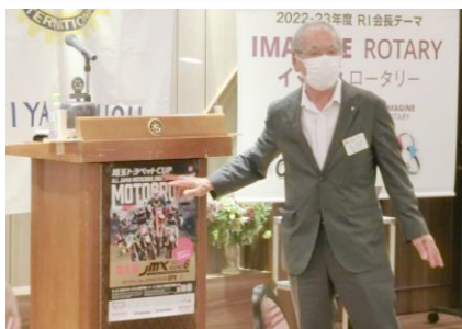
泉 会員 全日本モトクロス選手権PR